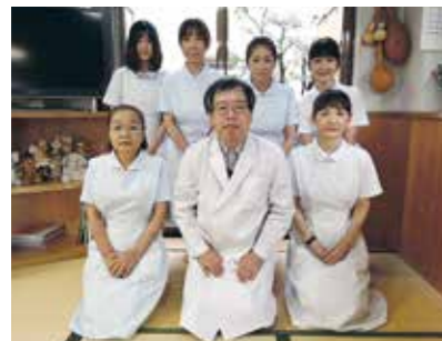
先生とスタッフの皆さん

内視鏡検査・画像診断はもとより、高齢化に伴い心肺機能評価を依頼するケースも多く、詳細な返事をいただき大変に感謝しています。今後とも宜しく願います。